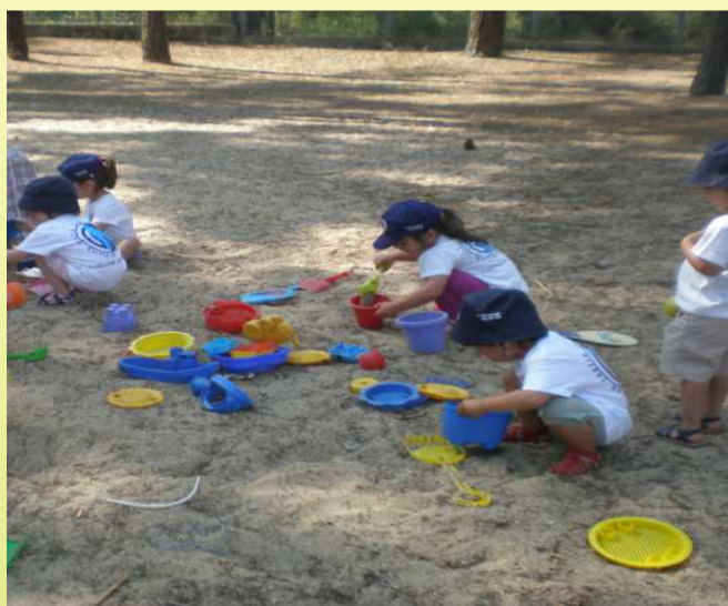
Praia Centro Infantil

No passado dia 28 de junho, a Creche e Creche-Familiar realizaram um passeio ao parque da Verdizela, com o objetivo de promover uma atividade conjunta entre os finalistas das duas respostas sociais. Foi um dia muito bem passado, todas as crianças que participaram na atividade exploraram e aproveitaram ao máximo as potencialidades deste espaço. O dia foi passado em brincadeira, com um belo piquinique à sombra dos pinheiros!