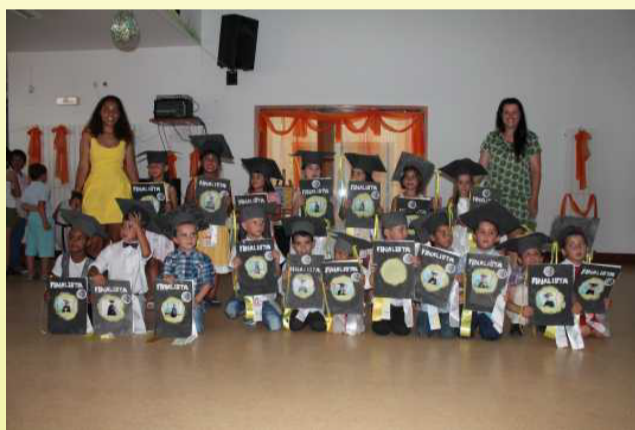
Festa de Final Ano

No passado dia 5 julho os meninos do CATL e Pré-Escolar juntaram-se para fazer uma festa de arramba. Baile de Finalistas, ocasião serviu para entrega de diplomas aos meninos crescidos, Pré-Escolar que entram para o 1º ciclo, como a despedida dos meninos de CATL.